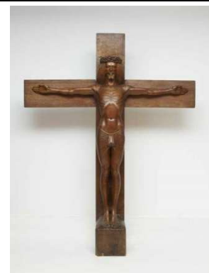
Georges Lacombe Autoportrait en crucifié (1898)