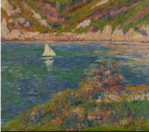
Henry Moret, Paysage de Doëlan à la voile blanche, 1898, huile sur toile, collection musée des beaux-arts de Brest métropole, legs Monique Le Bras-Lombard, 2019.