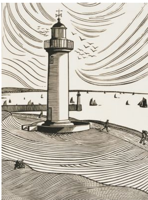
René Quillivic, Le phare , 1921, gravure sur bois, collection musée des beaux-arts de Brest métropole (détail).

Rotonde du premier étage. Exposition présentée jusqu'au 25 août 2019.