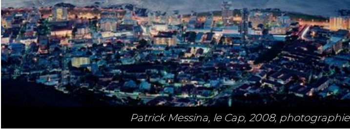
Patrick Messina, le Cap, 2008, photographie, collection artothèque du musée des beaux-arts de Brest