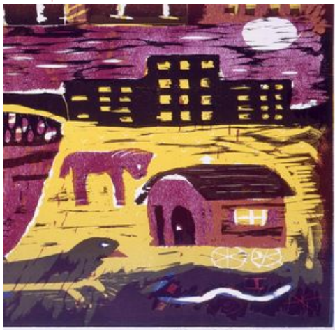
Rémi Blanchard, sans titre, vers 1987, gravure sur bois