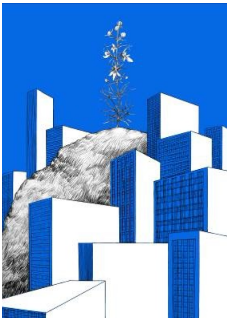
Stéphanie Nava, Projet Bel Vedere, 2013, ensemble de sept affiches numérotées et signées, impressions numériques, collection artothèque du musée des beaux-arts de Brest métropole.