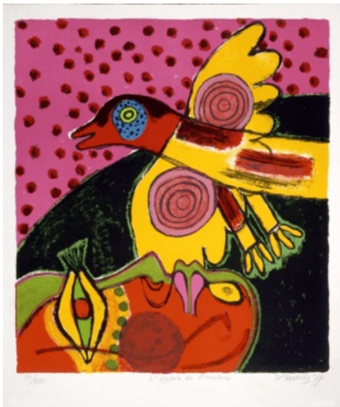
Corneille, L'essor de l'oiseau , 1977, lithographie, 65 x 50 cm