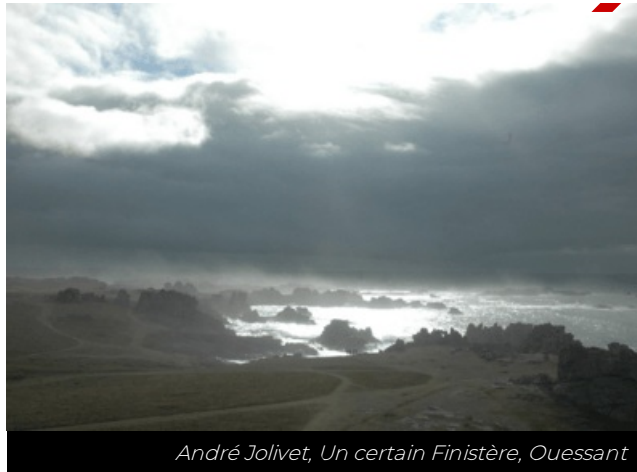
André Jolivet, Un certain Finistère, Ouessant

En partenariat avec la bibliothèque d'étude de Brest