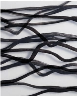
Frédérique Lucien, Oh solitude des rivages incertains