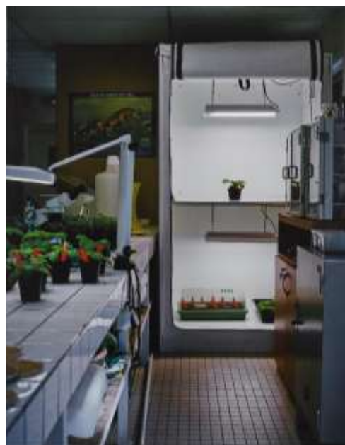
Yann Mingard, Deposit , 2012, photographie, tirage argentique contrecollé sur aluminium, collection artothèque du musée des beaux-arts de Brest métropole.

À travers sa série Deposit , Yann Mingard capture les lieux de préservation des semences végétales et animales. C'est le cas ici du Conservatoire botanique national de Brest où l'image a été réalisée.