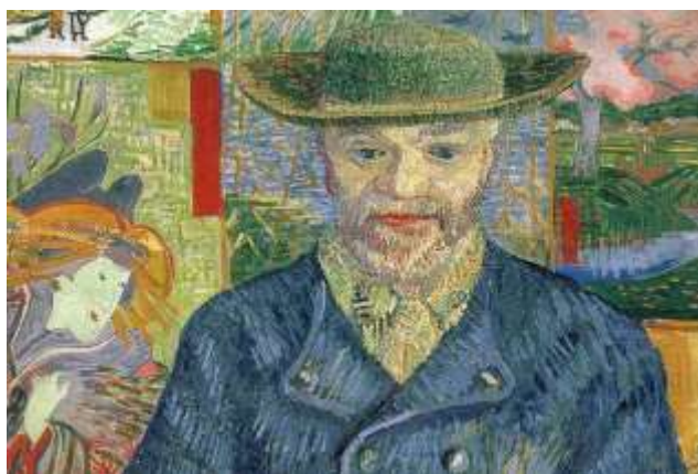
Image extraite du film Van Gogh et le Japon .