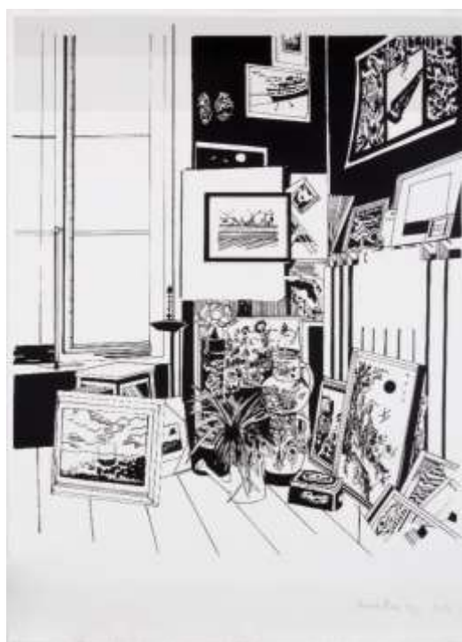
Chourouk Hriech, Le Coin de mon salon , 2019, sérigraphie sur papier, collection artothèque du musée des beaux-arts de Brest métropole. © ADAGP, Paris, 2020.