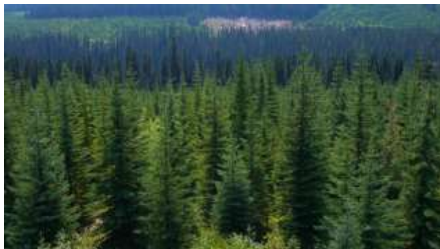
Image extraite du film L'Intelligence des arbres .