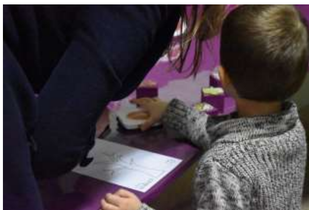
Atelier tampons autour de l'exposition D'art en arbres .

Réservation conseillée au 02.98.00.87.96.