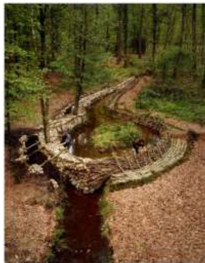
Gilles Bruni et Marc Babarit, L'île du barrage, capturer ensemble le ruisseau qui nous sépare , installation dans la forêt Domaniale de Loudéac, 1993, photographie, collection artothèque du musée des beaux-arts de Brest métropole.