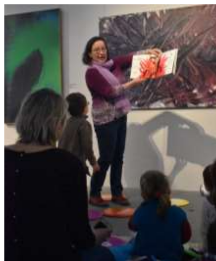
Visite pour les tout-petits.

Visites organisés dans le cadre des Semaines de la petite enfance.