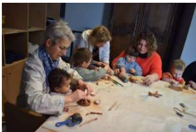
Atelier pour les tout-petits.

Ateliers organisés dans le cadre des Semaines de la petite enfance.