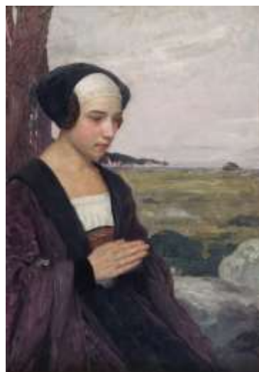
Edgard Maxence, La prière bretonne (détail), huile sur bois, collection musée des beaux-arts de Brest métropole.