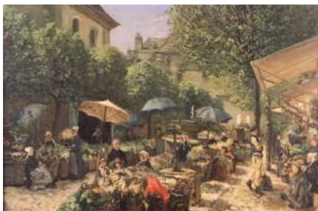
Henri Hombroon, Brest, le marché de Saint-Louis , 1882, huile sur toile, collection musée des beaux-arts de Brest métropole.

Mercredi 18 et samedi 21 mars à 14h30 et 16h. Accès libre, dans la limite des places disponibles et sur présentation d'un billet d'entrée au musée.