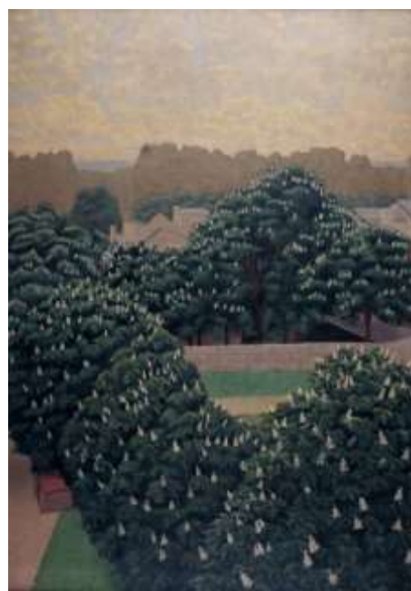
Charles Lacoste, Marronniers en fleurs à Paris , 1900, huile sur carton, collection musée des beaux-arts de Brest métropole.