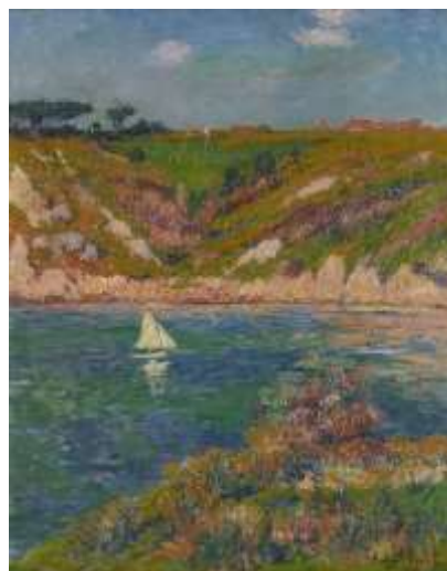
Henry Moret, Paysage de Doëlan à la voile blanche , 1898, huile sur toile, collection musée des beaux-arts de Brest métropole, legs Monique Lombard, 2019.